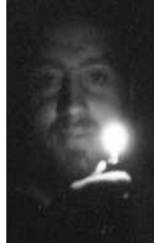
Já na tripu. Dochází ke změně na molekulové úrovni. Většinou беру podobu nějaké slavné osobnosti.

Tak tedy, to jsem já. Nejmenší velikán dějin. Zůstává za mnou mnoho stop, ale jen některé budou vryty do paměti lidstva.