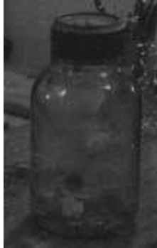
Já v normálním stavu. Nyní bývám maskován za flašku vod vokurek uzavřenou budíkem.

duševní. Při 80cm vzrůstu a 250vekagramech hmotnosti, má moje bezvědomí nemnoho příležitostí rozvinout do maxima své schopnosti. Na začátku 20-tého století jsem pomáhal Rokefelerovi při odhalování nových ložisek ropy, ve štrnáctém roce jsem spolu s Jaroslavem Cimrmanem asitoval při zavraždění pana Ferdinanda Hapsburského. Slavný vědec Alojs Ejnštejn vděčí mému přispění za objev teorie relativity a Sergej Ejnštejn by bez mého talentu nebyl schopen vytvořit slavnou scénu kočárku jedoucího po ohromném schodišti za mohutné střelby. Ovšem nejdůležitějším (bohužel ne však známým tak, jak by zasloužil) byl objev a zpracování teorie flešbeků. Pro zvýraznění mého vynikajícího charakteru přikládám dvě fotky z rodinného alba: