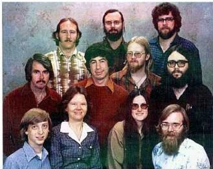
Microsoft Corporation, 1978

Regulérně, sem přišel dneska do firmy, páčto měli problém. Nefungovaly tiskárny, won tam normálně xodí kámoš, jenže má dovolenu, taxem musel já. Fšexno se zdálo v pořádku, nastavení,